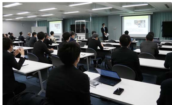
写真は前回の展示場とセミナー (2022年2月)