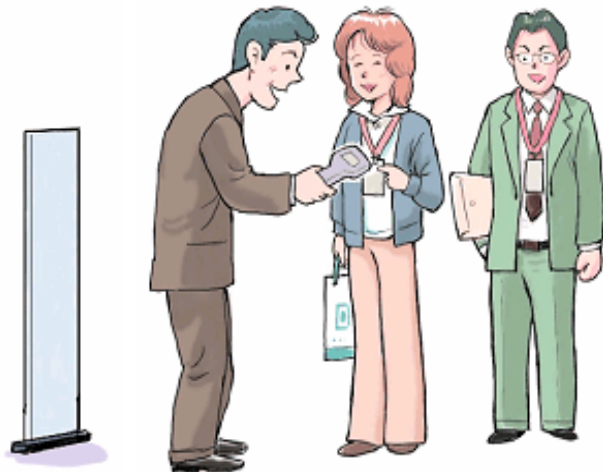
図2. ハンディタイプ