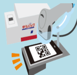
リーダー ユーザーのスマホ